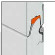
Panel s hrúbkou 40 mm. U=1,12 [W/m 2 K]*.

Pre energeticky úsporné domy máme špeciálnu ponuku: bránu VENTE K2 RFS 60 s hrúbkou zvýšenou na 60 mm. Táto mimoriadne teplá brána má dodatočné dvojité tesnenie spodného panela, tesnenia medzi sekciami a celoobvodové tesnenie zamedzujúce vznik tepelných mostov medzi stenou a uhlovými profilmi. Vďaka tomu je možné dosiahnuť súčiniteľ U=0,9 [W/m 2 K]*.