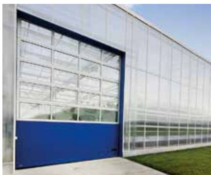
SEKSIONÁLNA BRÁNA K2 IM oceľová, presklená, s mikroprofilmi