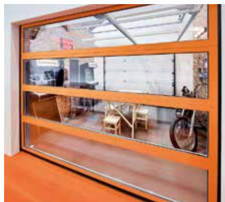
SEGMENT IP BEZ ZVISLÝCH STĹPIKOV Brána s presklenými segmentmi sa môže využiť ako výstavný priestor.