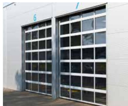
SEKSIONÁLNA BRÁNA K2 IP s preskleným plášťom