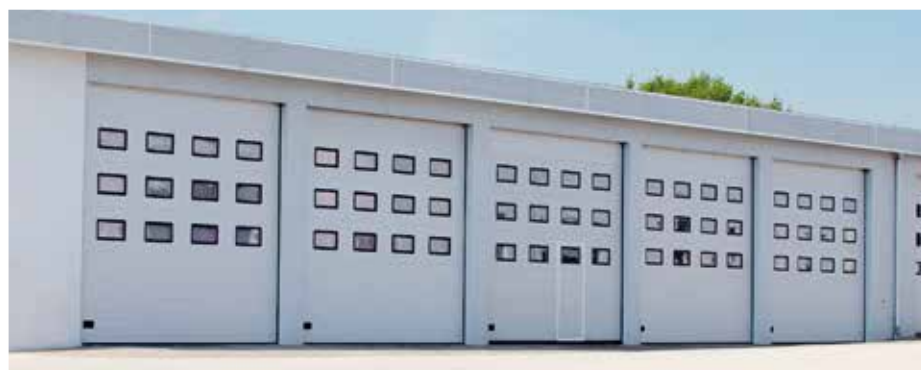
PANELY OCEĽOVÝCH BRÁN S OKNAMI Prepúšťajú denné svetlo do interiéru a zlepšujú podmienky práce.