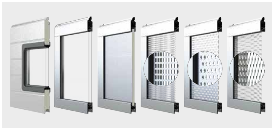
ŠPECIÁLNE SEGMENTY (zľava): IS/IA s oknami, IP s dvojitém zasklením, IP s tepelnou prestávkou, IP s perforovaným plechom, IP s hliníkovou sieťou

Zaujímavým riešením môžu byť, v prípade oceľových brán, plášte s okennou výplňou alebo presklené hliníkové segmenty. Segmenty sú vybavené jednoduchým alebo dvojitém zasklením, ktoré je zhotovené z trvácneho plastu, odolného voči mechanickému poškodeniu. Brány tak predstavujú zaujímavý architektonický prvok. Presklené brány sa môžu využiť aj ako výstavný priestor alebo na oddelenie priestorov v objekte, ak sú vyplnené matným, dymovým alebo mliečnym akryl sklem.