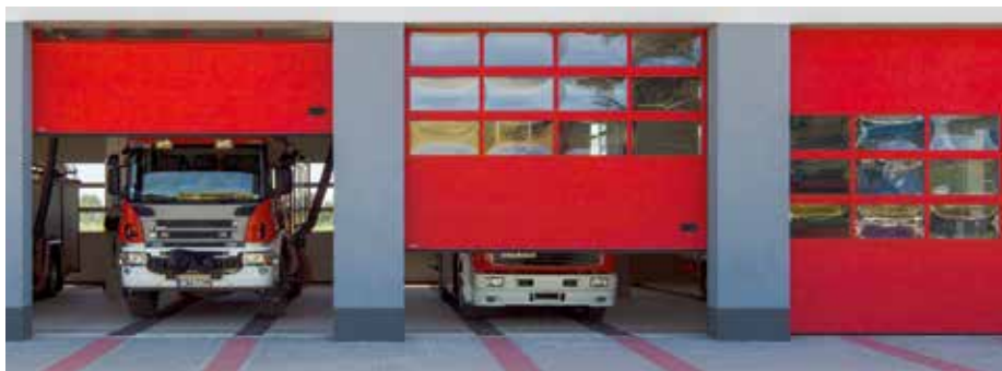
SEKSIONÁLNA BRÁNA K2 IA hliníková s preskleným plášťom

plášť IS/IA, plášť IM, plášť IRFS 60, plášť IPS, plášť IPD, plášť IPT