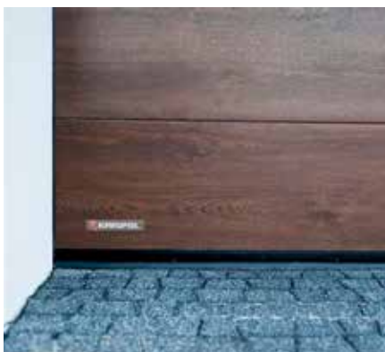
PANELY GARÁŽOVÝCH BRÁN Rovnaké vzory a farebné odtiene garážových brán nájdete aj v ponuke priemyselných brán.